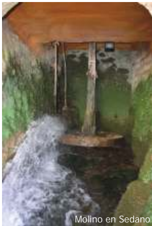
Molino en Sedano

recuperación de una gran parte de las condiciones naturales y también permitió que los pueblos conservaran toda la belleza y el sabor popular de su historia y sus tradiciones.