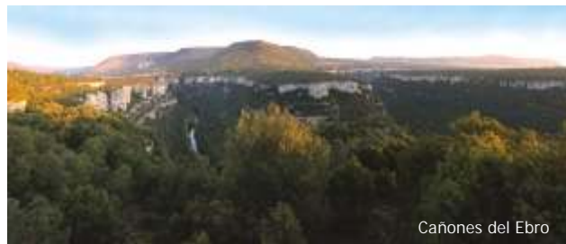
Cañones del Ebro

Al contrario que las loras, las laderas presentan fuertes pendientes, en general de más del 30% en forma de un talud continuo y homogéneo a veces interrumpido por imponentes resaltes verticales de calizas y dolomías. En estas zonas la orientación de las laderas condiciona enormemente su vegetación.