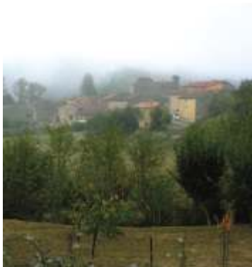
Población de Arreba

En el amplio espacio del Parque, sobre el que la naturaleza ha forjado este singular y bello paisaje, el hombre ha dejado su huella indeleble salpicándolo con un gran número de pequeños núcleos urbanos, casi todos ellos muy poco poblados, pero que acogen, diseminados por sus términos municipales, joyas de carácter histórico y cultural: restos prehistóricos como dólmenes y necrópolis, arte románico, palacios blasonados de presencia imponente, etc.