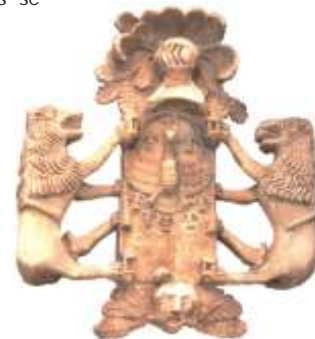
Escudo en Tubilleja

Con estas declaraciones se pretende compatibilizar la coexistencia del hombre y sus actividades con el proceso dinámico de la naturaleza, a través de un uso equilibrado y sostenible de los recursos, mejorando la calidad de vida de estos y asegurando su entorno para generaciones futuras.