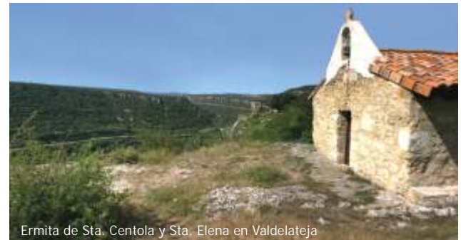
Ermita de Sta. Centola y Sta. Elena en Valdelateja

El Cañón del Ebro entre Valdelateja y Pesquera se puede recorrer en una ruta circular: a la ida por la antigua central eléctrica de El Porvenir y a la vuelta por Cortiguera. El tramo del Cañón del Ebro que transcurre entre Orbaneja del Castillo, Escalada y