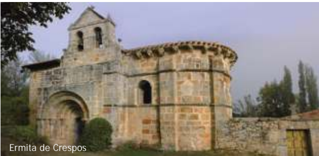
Ermita de Crespos

de las Santas Centola y Elena en Valdeleiteja, ejemplo de transición tardo visigoda de finales del siglo VIII. Dicha ermita y el abandonado pueblo de Siero es también ejemplo de un fenómeno habitual en estas poblaciones, que cambiaron su emplazamiento elevado de carácter defensivo por los valles mucho más apropiados