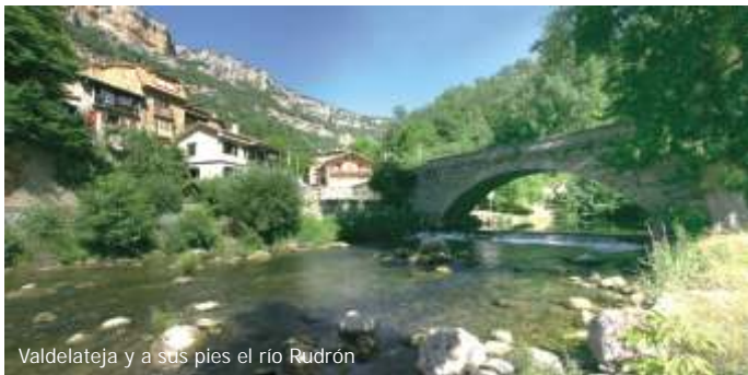
Valdelateja y a sus pies el río Rudrón

En el amplio espacio del Parque, sobre el que la naturaleza ha forjado este singular y bello paisaje, el hombre ha dejado su huella indeleble salpicándolo con un gran número de pequeños núcleos urbanos, casi todos ellos muy poco poblados, pero que acogen, diseminados por sus términos municipales, joyas de carácter histórico y cultural: restos prehistóricos como dólmenes y necrópolis, arte románico, palacios blasonados de presencia imponente, etc.