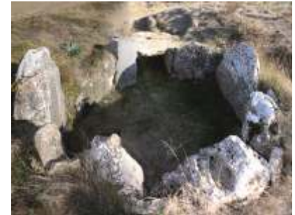
Dolmen de la Cotorrita en Porquera de Butrón.

Conjuntos de arte rupestre, como los encontrados en la cueva del Azar en Orbaneja del Castillo, demuestran que estas tierras estaban ya habitadas en el Paleolítico Superior. Sin duda la situación del Parque, en un lugar de paso entre el Cantábrico y la Meseta del Alto Ebro, explica la pronta presencia del hombre. Entre su patrimonio arqueológico destaca uno de los conjuntos de monumentos megalíticos más importantes de Europa Occidental. Los dólmenes y túmulos, construidos hace unos 5.000 años, eran lugares de enterramiento colectivo. Los dólmenes son del tipo denominado sepulcro de corredor y constan de una cámara circular y un largo pasillo de acceso, ambos construidos con grandes lajas de piedra. Los más importantes han sido objeto recientemente de un proceso de restauración. Uno de los más llamativos es el de Las Arnillas en Moradillo de Sedano. La Cabaña en Sargentos de la Lora es el único que recibe cuidados permanentes de conservación por parte de sus vecinos, pero no son los únicos ejemplos, interesante es también entre otros el de Ciella-Fuentepecina cerca de Sedano.