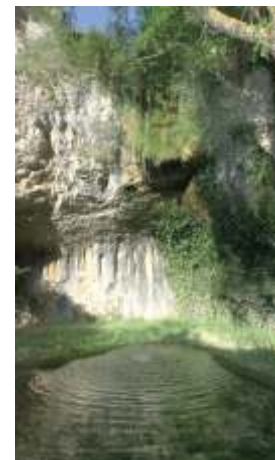
Cascada en Hoyos del Tozo

Muy destacados por su belleza y singularidad son el Pozo Azul de Covanera, la cascada de Orbaneja del Castillo con sus formaciones de tobas calcáreas, la desembocadura del Rudrón en el Ebro en Valdelateja con su meandro abandonado, los desfiladeros de Los Tornos de Tudanca y el de los Hocinos en el Valle de Manzanedo y el valle ciego del río Rudrón en Basconillos del Tozo.