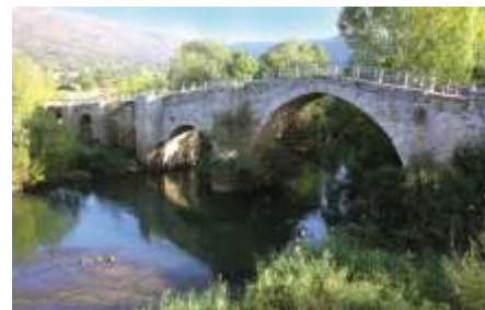
Puente de Villanueva-Rampalay

En gran parte de los recorridos es necesario cruzar los ríos, y nada mejor para ello que utilizar los innumerables puentes que salpican el Parque. Los hay en casi todos los pueblos y algunos son muy antiguos. En Bañuelos uno conserva trazas posiblemente romanas y es famoso el puente romano de Santa Coloma de Rudrón en la desembocadura del río San Antón. Importantes son los cuatro puentes de Covanera y el de Valdelateja que une al pueblo dividido por el río Rudrón.