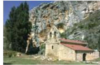
Iglesia en Hoyos del Tozo

Valdelateja donde recibe a su afluente el Rudrón, que discurre igualmente entre escarpados desfiladeros.