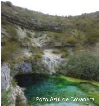
Pozo Azul de Covanera

Esta surgencia de naturaleza kárstica y aguas cristalinas tiene un caudal medio anual de unos 1.000 l/s y en su interior los espeleobuceadores han explorado más de 9.600 metros de galerías.